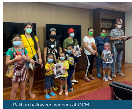
Palihan halloween winners at OCM

Isa sa mga highlight ng proyekto ang mga patimpalak gaya ng Pangaluluwa: Pinoy Halloween Costume Contest na nilahukan ng 172 mag-aaral. May naitampok din na 61 mag-aaral na mga nagwagi sa Palihan Daily Challenges mula sa iba't ibang larangan. Sinusuportahan din ng QC Palihan ang mga campaigns upang maghatid ng mga mahahalagang impormasyon sa QC Citizens ukol sa mga aktibidad at proyekto ng lungsod Quezon.